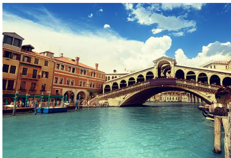
Міст Ріальто, Венеція.

Переїзд до готелю поблизу Мілана. Пізніше поселення в готель, ночівля.