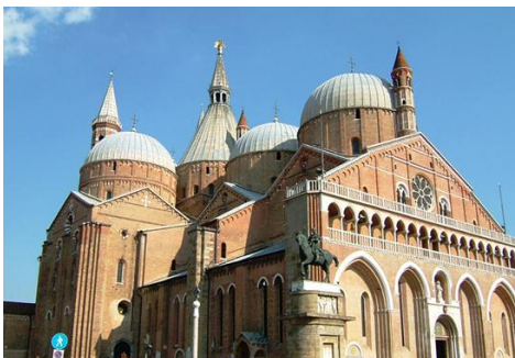
Базиліка Св. Антонія Падуйського.