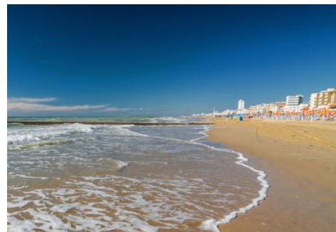
Лідо ді Езоло.