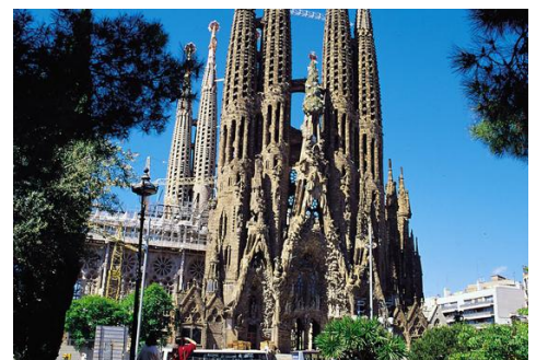
Саграда Фамілія, Барселона.